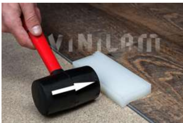
Фото 16. Фото 17. Фото 18.

После укладки каждой планки и после укладки каждого ряда обязательно нужно сделать круговую подбивку всех планок (подбивную планку вы можете купить либо взять у наших дилеров на время укладки).