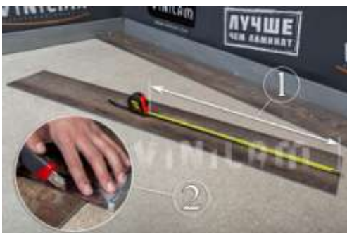
Фото 8. Фото 9. Фото 10.

3. Укладывая второй ряд СЛЕВА НАПРАВО, берем планку ВИНИЛАМ CLICK HYBRID, отмеряем ее на 1/3 часть, используя нож и линейку, под углом 90^\circ делаем надрез, а затем разламываем планку на части.