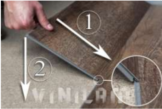
Фото 11. Фото 12.

Отрезанным краем подводим к стенке, оставляя тепловой зазор 3-5 мм, подводим под углом продольным замком и защелкиваем ее по продольному шву к планкам первого ряда.