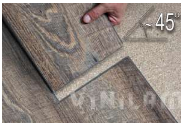
Фото 3. Фото 4. Фото 5.

2. Вынимаем вторую планку, подводим ее поперечным замком под углом к той планке, которая лежит на полу, и защелкиваем ее.